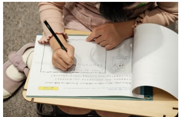
2023年度の「AWT FOCUS」親子向けプログラムの様子