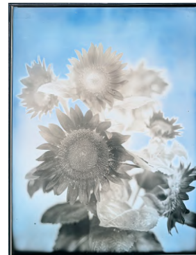
新井卓《飯館の向日葵 No. 4、福島、2017》2017年