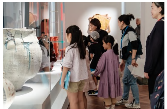
2023年度の「AWT FOCUS」キッズ・ユース向け鑑賞ツアーの様子