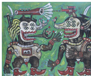
ヘリ・ドノ《The Two Generals》2016年