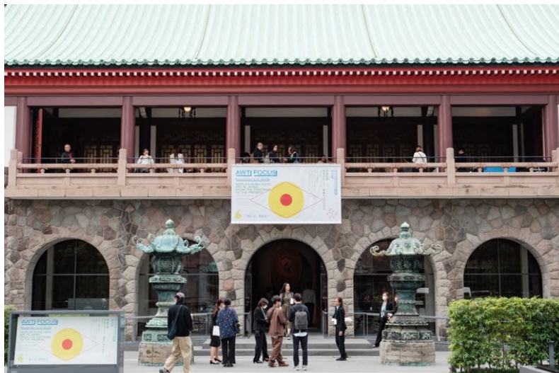
2023 年度「AWT FOCUS」会場外観（大倉集古館、東京）

現存する日本最古の私立美術館である大倉集古館を会場に開催される AWT FOCUS は、美術館での作品鑑賞とギャラリーでの作品購入というふたつの体験を掛け合わせた展覧会です。毎年異なるテーマのもとでキュレーションされ、出展作品はすべて購入できます。