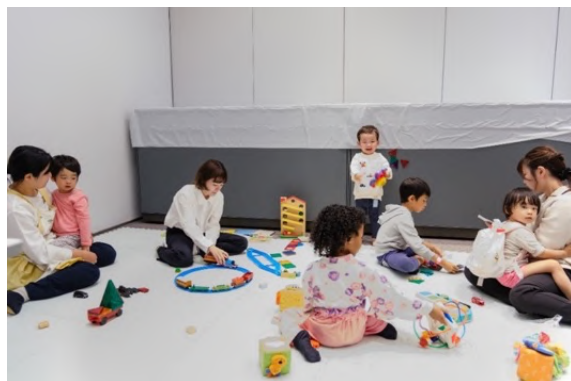
2023年度 託児所の様子

本サービスはアート教育の場も兼ねています。今年のAWT FOCUS の展示作品と同じ20世紀から現代までに活躍したアーティストが手掛けた本を読み聞かせたり、一緒に絵を鑑賞したりすることで、お子さまが自然にアートと触れ合える環境を提供します。