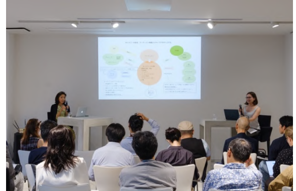
2023年度のミートアップの様子

ミートアップでは、「これからのアートコレクターのためのスタートアップガイド」と題して、現代アートの作品をコレクションしてみたいと考えるあらゆる人を対象にした3セッション構成のプログラムが開催されます。世界最高峰のアートフェアである「アートバーゼル」とのコラボレーションのもと、3日間にわたってアート鑑賞や購入の方法から世界のアートワールドの最新情報、コレクションの傾向までを立体的にとらえる手引きとなるツアーやトークを実施します。