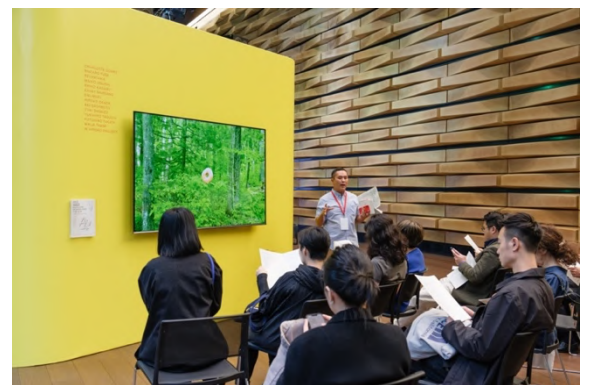
2023年度の「AWT VIDEO」の解説の様子